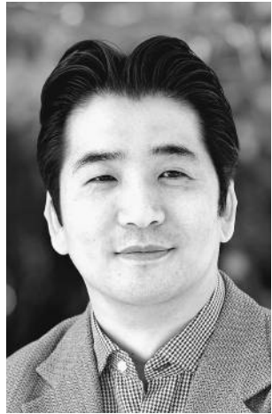
おぐろ・かずまさ 74年生まれ。一橋大博士。 財務省などを経て現職。 専門は公共経済学